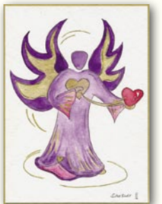
Engel der Transformation