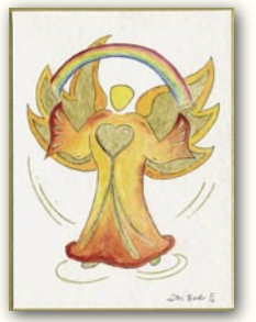
Engel der Kreativität