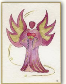
Engel der liebenden Präsenz

In dieser Berührung öffnen wir den Engeln Seelentore, durch die sie uns mit Licht und Liebe erfüllen können. Engel erinnern uns daran, dass wir ein Stück des Himmels in unserem Herzen tragen, eingebettet in dem hellstrahlenden göttlichen Funken des ICH BIN.