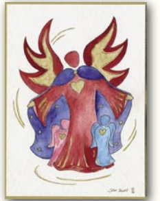
Engel der Fürsorge